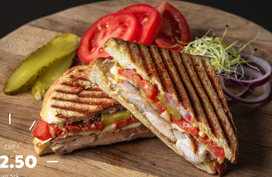
Grilled Chicken Cheese Melt